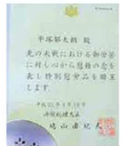
▲ 拘留されたことへの慰労品の銀杯と賞状

あのような悲惨な戦争は2度とあってはならないことで、私の世代は、これらの事実を戦争を知らない世代に伝えていく責任があると思います。