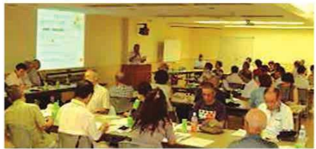
▲ 三茶しゃれなード