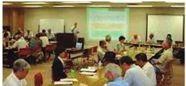
▼ 烏山区民センター

ュニケーションがうまく取れている、または信頼関係ができている場合ほど、仕事への満足感や働く喜びを実感しているケースが多くみられます。事務局の対応が十分でない、就業現場に来て実態を見てほしい等の声も出されました。