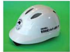
総会参加者に配布された安全ヘルメット ▲

高齢者の3大事故原因は、 ①走行する車の直前・直後の横断 ②横断歩道以外の横断 ③信号無視（歩行・運転時）です。