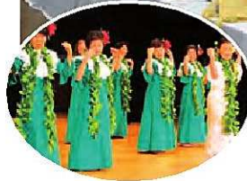
◀ 華やかなフラダンス