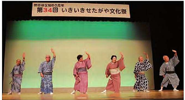
▲ 上野毛組 組長・班長総出演

2日間、例年どおりフラダンス、合唱、民謡、詩吟等盛りだくさんの演目のほか、2日目の正午には、恒例の和服・帯等をリメイクしたファッションショーが始まり、制作者自身がモデルになって登場し、人気を集めていました。