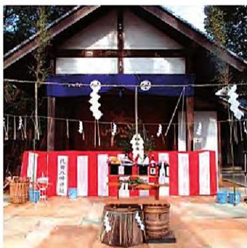
▲ 代田八幡神社境内