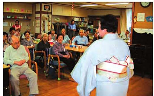
▼ 中町デイホームで踊りを披露

この2月に老人ホームからお座敷がかかっているの、年末まで練習を重ね、ボランティアの会員仲間を少しずつ増やして活動を広げて行く予定とのこと。