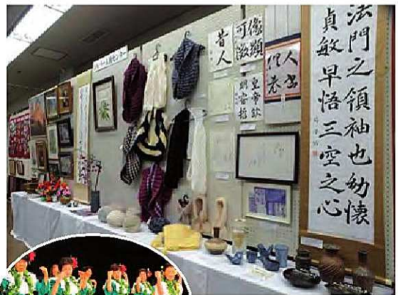
▲ 当センター作品展