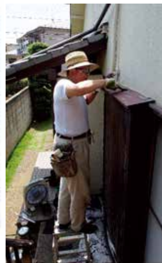
▲まず塗装を丁寧に剥いて綺麗な金属面に新しく塗り直す

頼まれて、雨漏りのもとをたどって部屋の天井に上がる」といったこともときにはあった。塗装仕上がりを良くするには労を惜しまない。