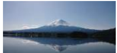
河口湖からの 逆さ富士

健康で、写真や歌等の趣味を楽しみながら日々を送っていますが、これも地域の人々との交わりがあってこそ。そして長年にわたり受け入れてくれているシルバー人材センターの会員であるが故の今日であると、感謝！感謝！