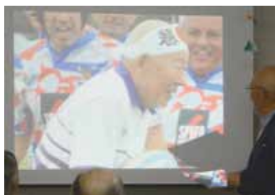
▲試合中の写真を解説。

昨年9月アルゼンチンで開催された「シニア世界ラグビー大会」に参加し、本場のタンゴやイグアスの滝に感動した話、最終戦で地元ブエ