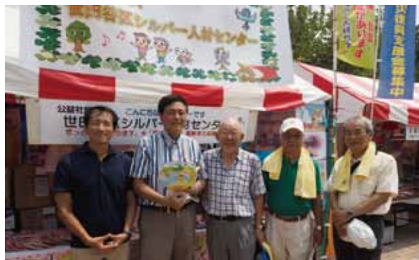
▲左より上島議長、保坂区長、会長、副会長、常務理事

産地直産の野菜をたくさん買い込んで帰る主婦や、あちこちのイベントを楽しむ家族連れで、大賑わいの真夏の一大イベントでした。