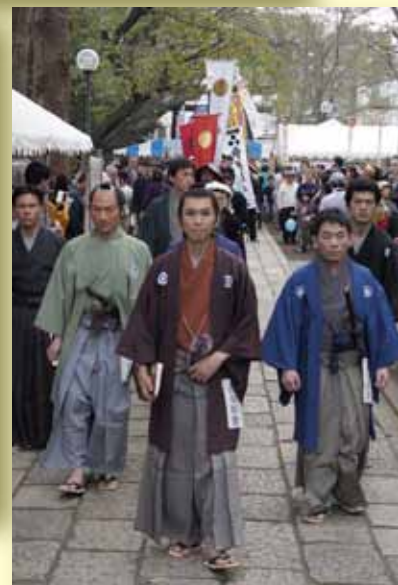
▲世田谷 幕末維新祭り