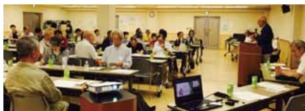
▲三茶しゃれなあどでの、2年次会員研修

出席者アンケート結果では、就業の際のマナーや安全が重要である、一人の行動で多くの会員が仕事を失うこともある等が関心の高い項目に挙がり、他