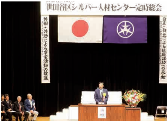
▲保坂区長のご挨拶

6月10日午後1時30分より世田谷区民会館ホールで、平成28年度定時総会が開催されました。