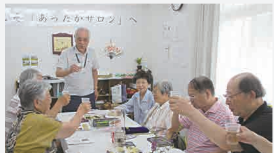
▲ブラジル紹介で、現地で人気の飲料ガラナで乾杯