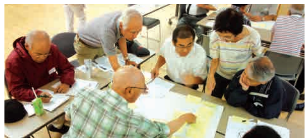
▲熱心にグループ討議する会員

解できた（96%）、マナー事例や安全就業が参考になった（47%）、就業体験・情報の交換の機会がほしい（61%）、他会員の考えや意見が参考となった（61%）等の項目でした。（本田）