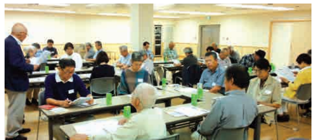
▲会長のご挨拶（写真は、すべて三茶しゃれなあと）