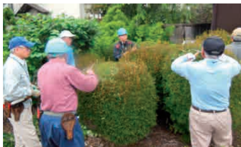
玉作りの剪定研修風景