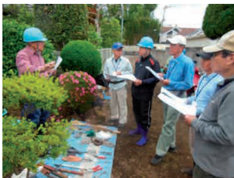
前澤氏（薄紫のシャツ）の講義を受ける5氏