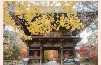
表紙の写真 門の左右に「阿吽」の仁王像、その裏側には風神・雷神像が有り、楼上に阿弥陀如来と二十五菩薩像が安置されています。いつもの散歩コースで撮影した写真です。

令和6年度(4月~6月) (対前年比) ・会員数 2,853名 (90名増) ・受注件数 4,852件 (175件減) ・契約金額 3億4,763万円 (550万円増) 会員数については、Instagram・Facebookへの新規WEB広告の効果もあり、昨年度に比べ増加傾向にあります。引き続き出張説明会等も積極的に開催し、新規会員の獲得を目指してまいります。事業実績については、受注件数は微減でありながら契約金額は昨年同時期と比較し、550万円の増となっております。今後とも安全就業を最優先に事業活動を行い、就業拡大に努めてまいります。