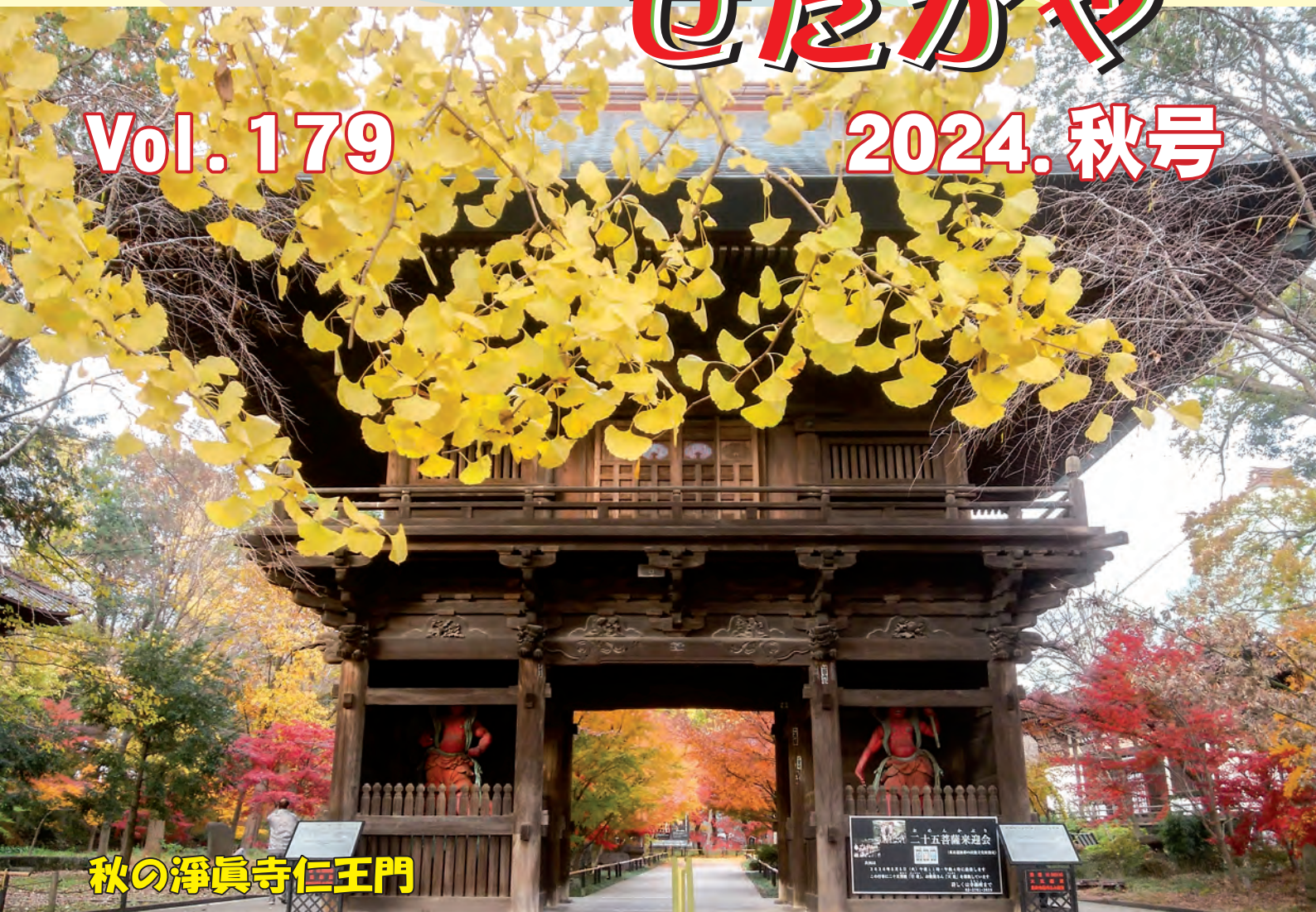
秋の淨眞寺仁王門