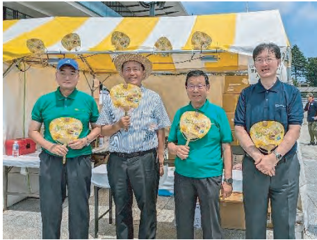
保坂区長をお迎えして

オープニングイベントでは迫力ある和太鼓(都立深沢高校和太鼓部演奏)の鳴り響く中、出店コーナーにはぞくぞくと区民の皆さんが集まり盛況を呈しました。