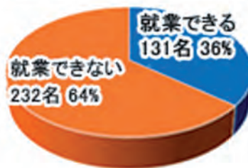
未就業者363名の内訳

◎未就業会員の内訳として363名中、就業できる会員36%、就業できない会員232名64%となり昨年度と比較し、倍増しました。