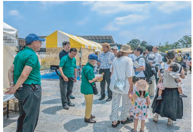
ブース前にも多くの家族連れが

当センターのブースでは、みなさまにうちわやプリント物を配布、PRに余念がありませんでした。