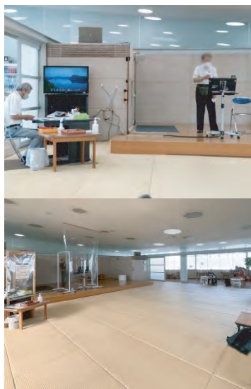
この広い部屋でカラオケ

カラオケの利用は60歳以上限定です。料金は一日360円、途中での出入りも自由で、弁当を広げている方も。朝9時から夕方4時まで、平日は30人ほど、土日は20人ほどと少ないので、利用者は広い部屋でのんびりとカラオケなどを楽しんでいらっしやいます。