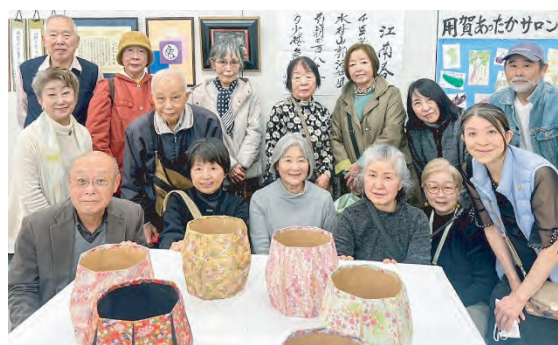
展示されたシルバー会員の作品の数々